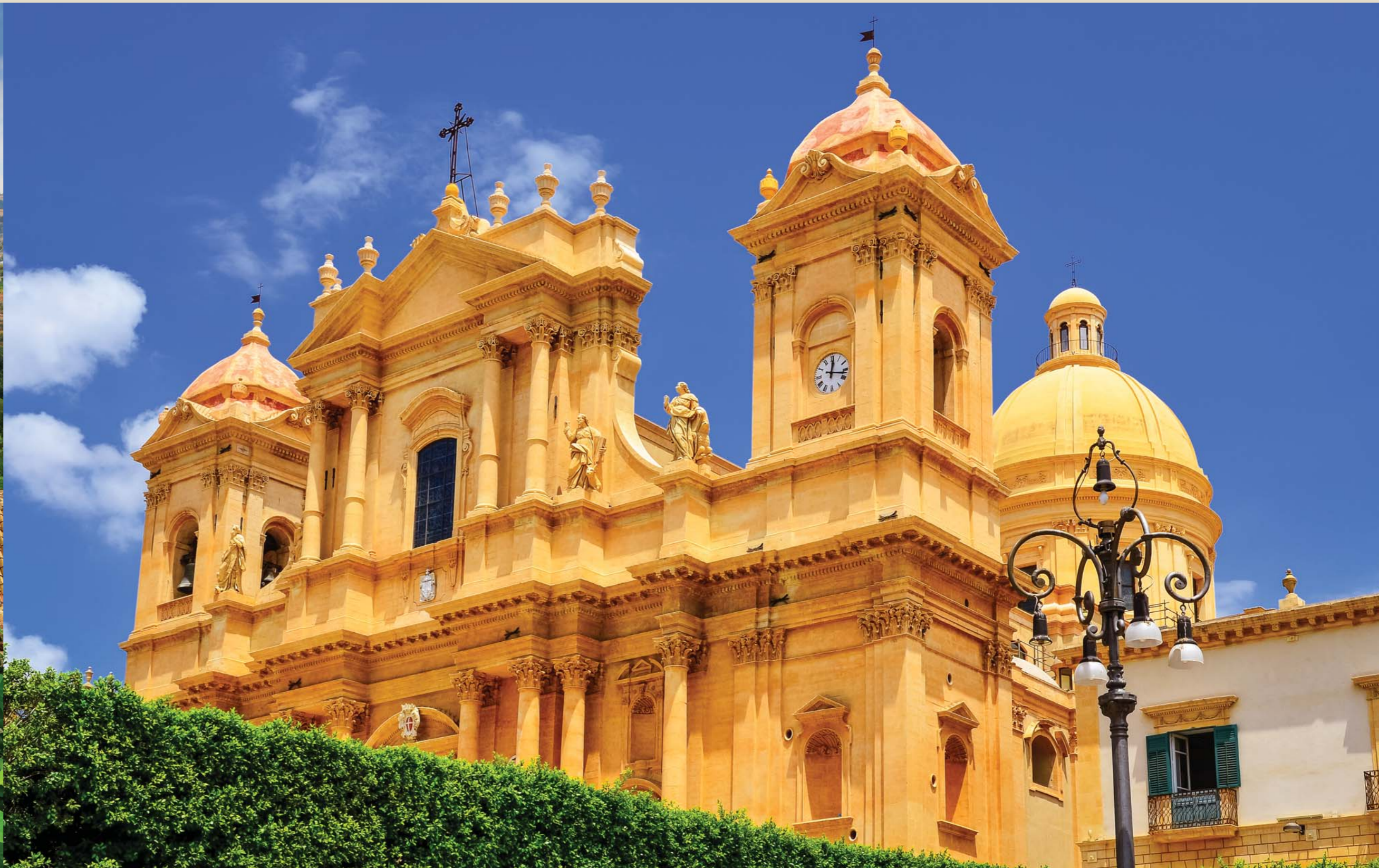
Bilder från Ragusaprovinzen